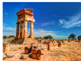
N - Sul de Itália, Puglia e Sicília Julho 12 dias