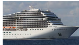
N - Cruzeiro no Mediterrâneo Junho 9 dias