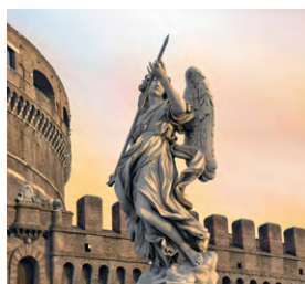
S - Roma – Encontro de Reformados Maio 5 dias