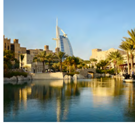
S - Dubai - Fevereiro De 26 de Fevereiro a 5 de Março

No entanto, se preferir desenhar uma viagem por medida, à sua medida, então consulte o Grupo Desportivo, use o nosso know-how e facilidades de pagamento. Somos capazes de o surpreender. Ou talvez não. Mas se tentar fica a saber.