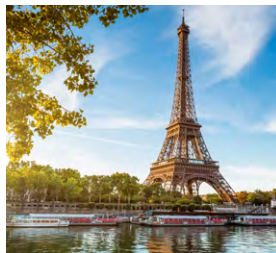
S - Disney Abril 4 dias