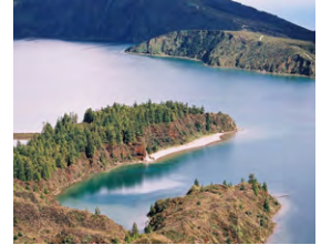
N - Convívio de Reformados nos Açores Agosto 4 dias