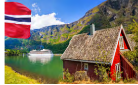
N - Cruzeiro na Noruega - Todos os Fiordes Maio 9 dias