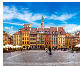
S - Polónia Junho 6 dias