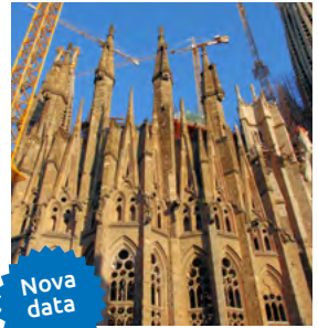
S – Girona, Barcelona e Narbonne – Encontro de Reformados De 13 a 17 de Outubro – 5 dias