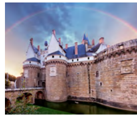
S – Nantes e Puy du Fou De 8 a 12 de Setembro – 5 dias