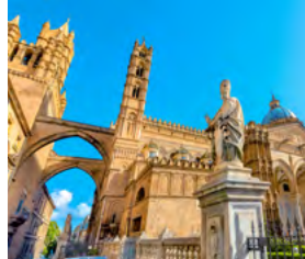
N – Sul de Itália, Puglia e Sicília De 3 a 14 de Julho – 12 dias

Mas se preferir desenhar uma viagem por medida, à sua medida, então consulte o Grupo Desportivo, use o nosso know-how e as nossas facilidades de pagamento. Somos capazes de o surpreender.