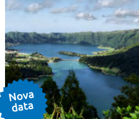
S – Açores – Terras de Bruma De 5 a 9 de Setembro – 5 dias