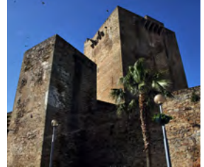
S – Por Terras de Fronteira De 1 a 3 de Outubro – 3 dias