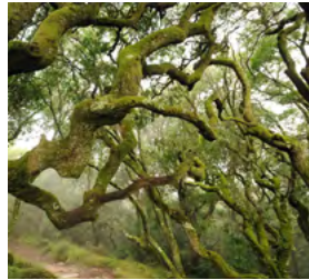
N – Fim-de-semana na serra do Buçaco De 28 a 29 de Agosto – 2 dias