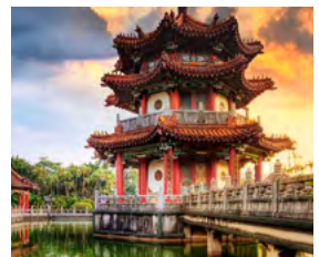
S – Taiwan De 1 a 10 de Dezembro – 10 dias