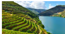
N – Alto Douro e Beira Baixa – Convívio de Reformados Junho – 4 dias