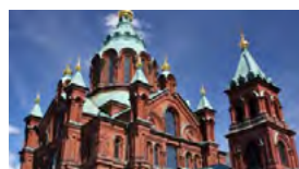
S – Helsínquia e S. Petersburgo Junho – 6 dias