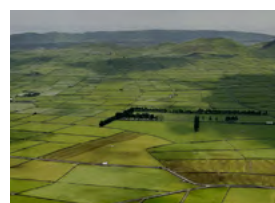
S – Açores – Encontro com Reformados Setembro – 5 dias