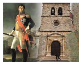
S – Por terras de Fronteira Outubro – 3 dias