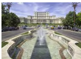
S – Roménia Maio – 8 dias