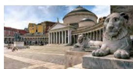
N – Sul de Itália, Puglia e Sicília Julho – 12 dias