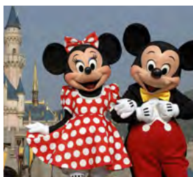
S – Disney Abril – 4 dias

No entanto, se preferir uma viagem por medida, à sua medida, por favor não deixe de consultar o Grupo Desportivo. Somos capazes de o surpreender.