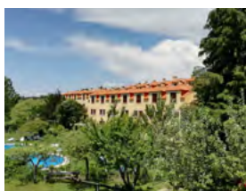
S – Seia – Qta. do Crestelo Maio – 3 dias