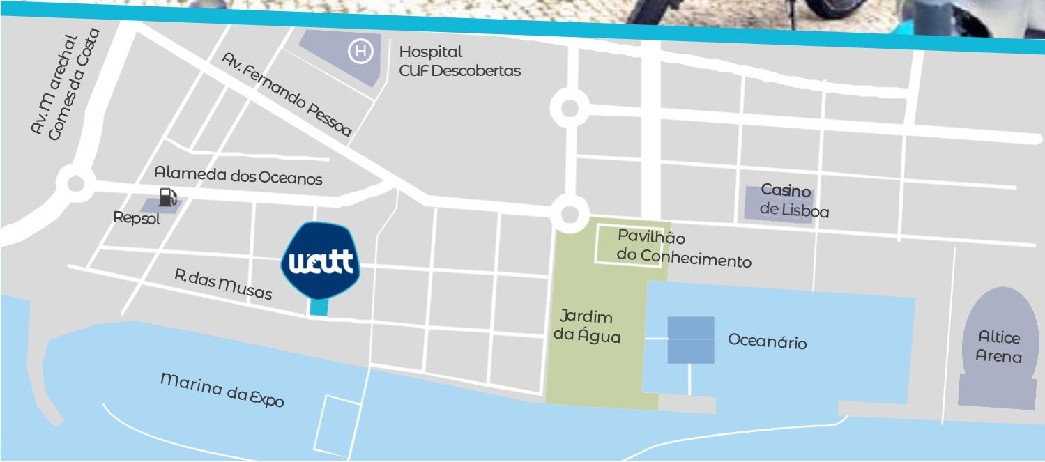
O nosso stand no Parque das Nações