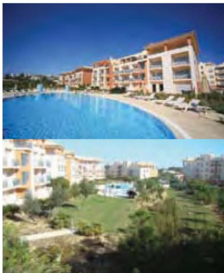
➤ ALBUFEIRA – AREIAS DE S. JOÃO – PARQUE DA CORCOVADA

Localização: em Areias de S. João, no Parque da Corcovada, próximo da praça de Touros, a 900 metros da praia.