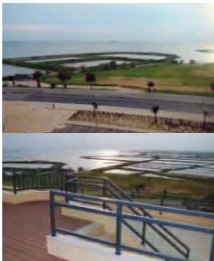
➤ OLHÃO – EMPREENDIMENTO VILLAGE MARINA

A recepção funciona no Parque da Corcovada entre as 9.00h e as 19.00h.